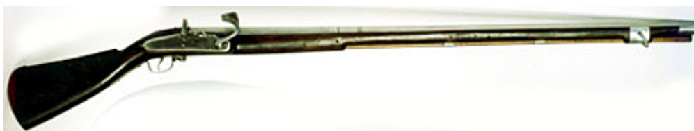
Musköt m/1680, med luntlås