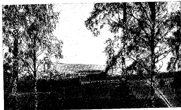
BANKERYSDALEN sedd från sydost.