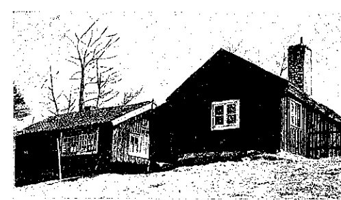
MILLERS SMEDJA I PRINTZERYD. Smedjan till vänster, gamla bostaden till höger.

Gamle Olaus ha- de varit skråets och fabriets be- trodde man, vil- ken såsom sak- kunnig var med och överlämnade leveranser av ge- vär i Stockholm. När gubben på sin ålderdom blind och förvärrt satt i