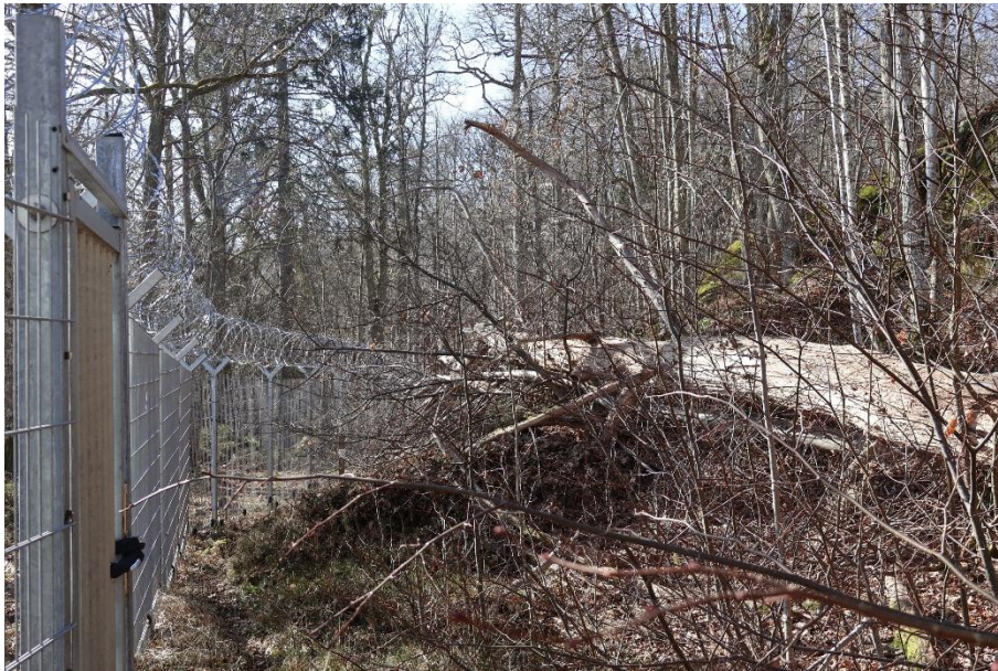
Hela berget är ett;