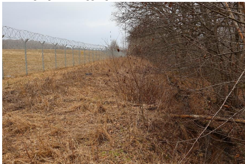
Rågängen går i diket/bäcken. Granbäck väster om Kortebo öster om.