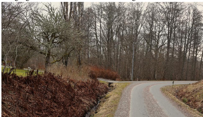
Bäcken fortsätter förbi infarten till Häggebergsvägen 24, in i "Naturskyddsområde"