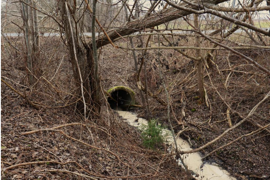
Även under G/C-vägen Jönköping-Trånghalla, Bankeryd, Habo är bäcken/rågängen kulverterad