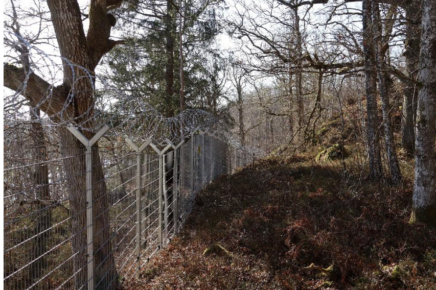
Rågängen går söder ut i "Bergsfoten", utefter det väl hägnade Vattenverket.