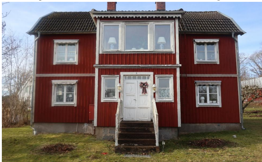
Vråvägen 5. Ett hus som flyttades 1920-tal, från Bankeryd hit av Karl Appelberg.