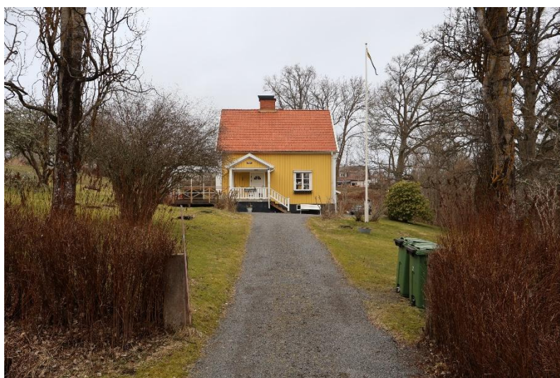
"Kullatorp" Häggebergsvägen 24 i Vrån.