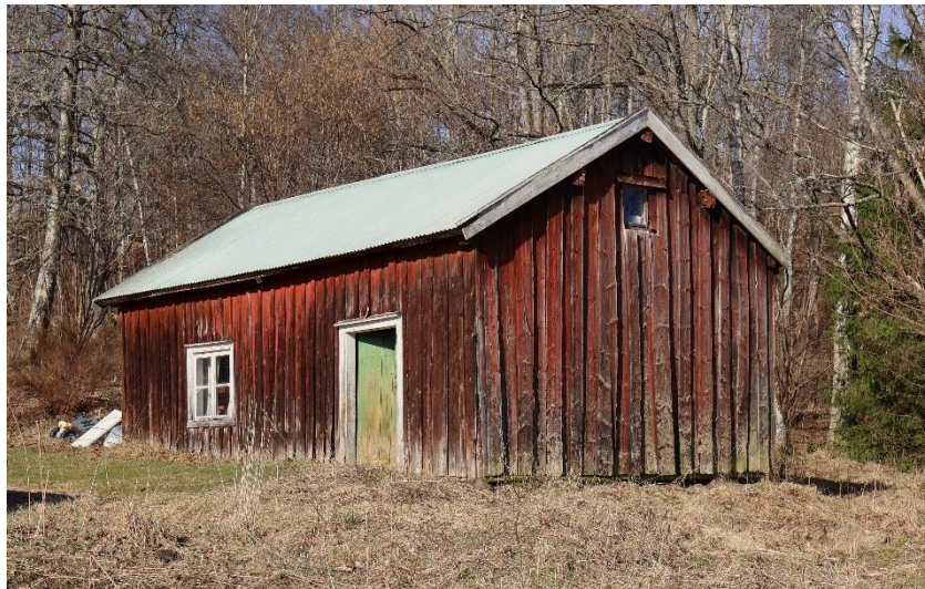
”Trumpetarbostället” under Granbäck, del av Vråvägen 5.