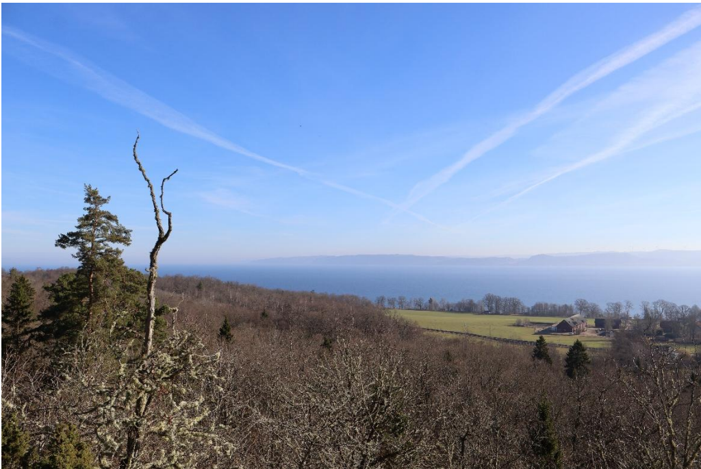
I bra väder kan man se hela södra Vättern. Nedanför bergbranten Granbäcks gård.