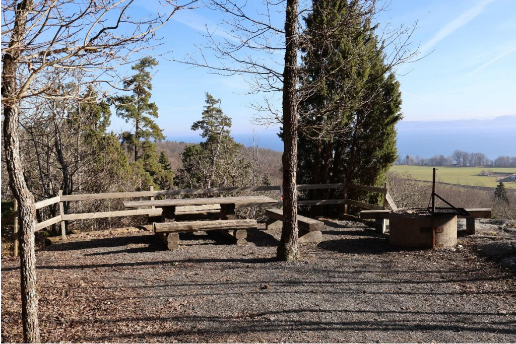
Med en liten avvikelse, in till Utsikten på Granbäcks mark.