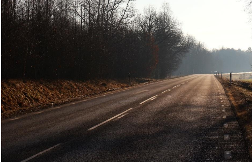
Tillbaka på Falköpingsvägen. Flasarp, norr om vägen. Skrikebo och Björnebergs söder om vägen.