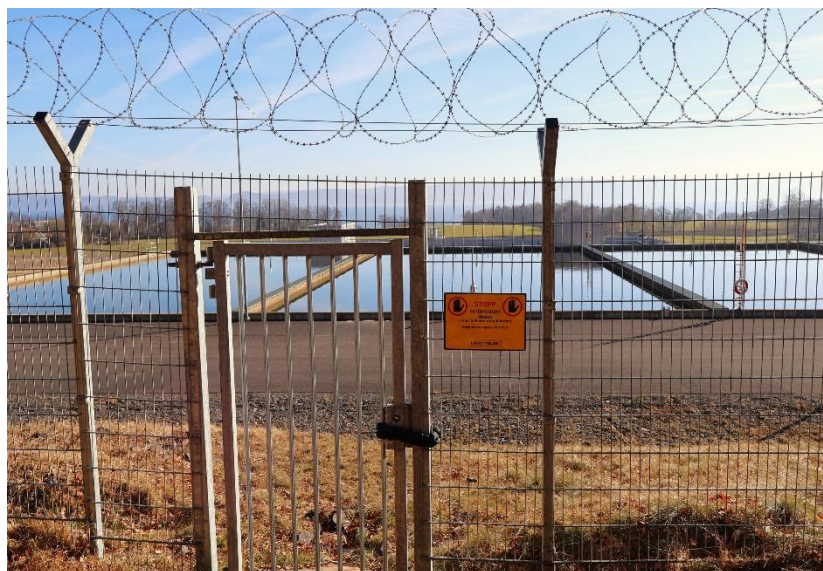
Vi är lyckligt lottade som har Vättern som vatten täckt! Självklart ett låst Skyddsobjekt!