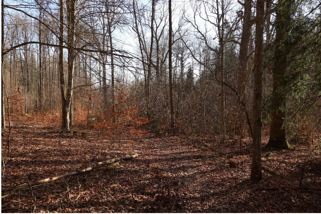
Genom "Häggeberg-Granbäcks Lövskogar"