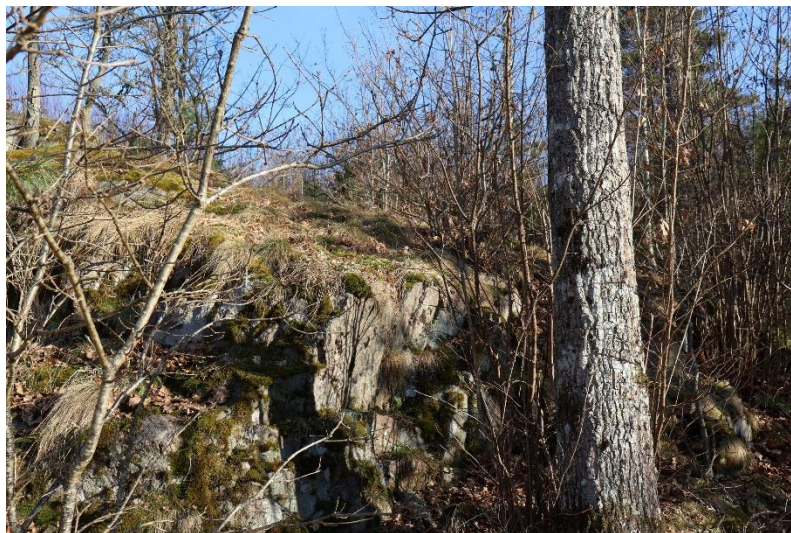
Högst upp, berg i dagen.