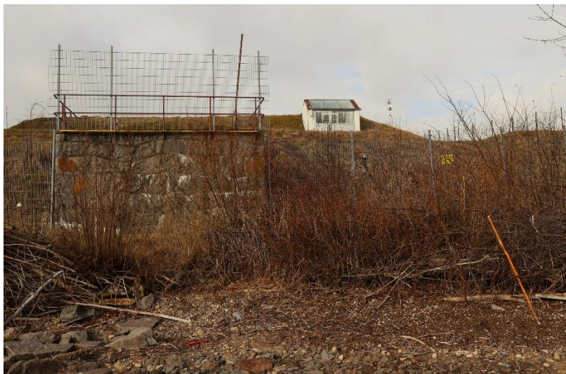
Pumpstationen från Vättern.