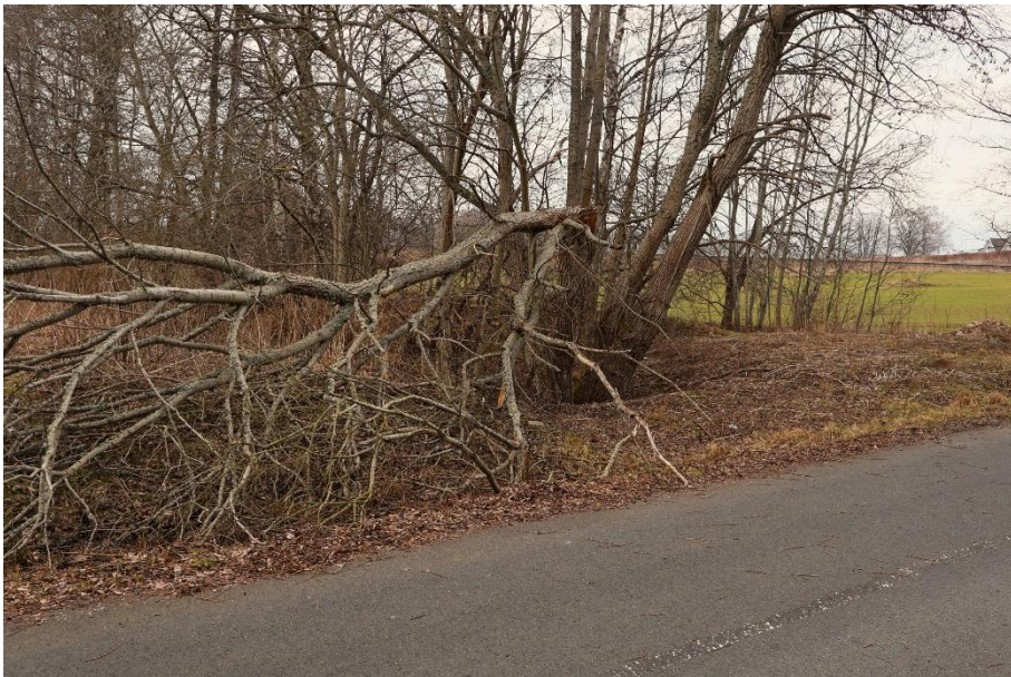
G/C-vägen används flitigt! Sop-saltas hela vintern. Bäcken/rågängen är inte vacker.