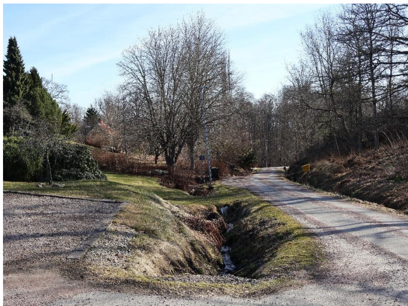
Vråvägen mynnar i Häggebergsvägen på Kortebo mark. Rågängen mellan Granbäck och Kortebo går i bäcken öster ut.