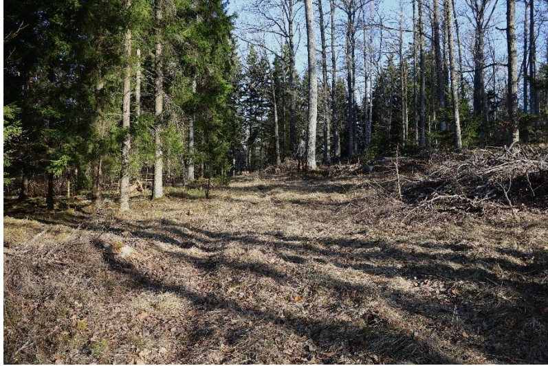
Högt där uppe, rågången mellan Flasarp i nordväst och Häggeberg i sydost