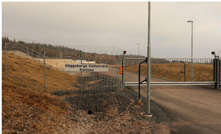
Intill infarten och grinden till Häggebergs Vattenverk , som geografiskt ligger på Granbäcks mark, Bankeryd.