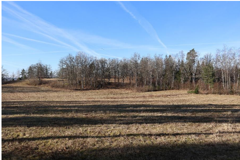
Passerade Grantorp öppna fält, på Häggebergs mark