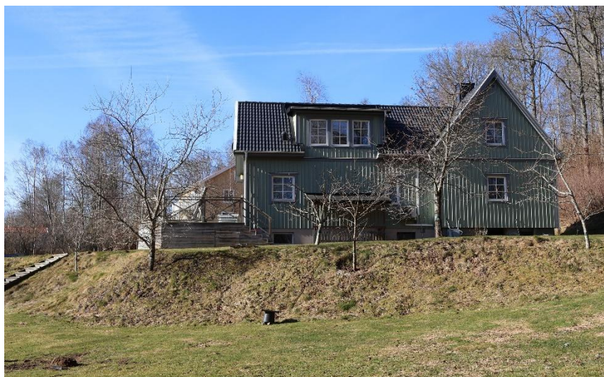
I den lilla byn Vran, kom jag upp i trädgården Vråvägen 13.