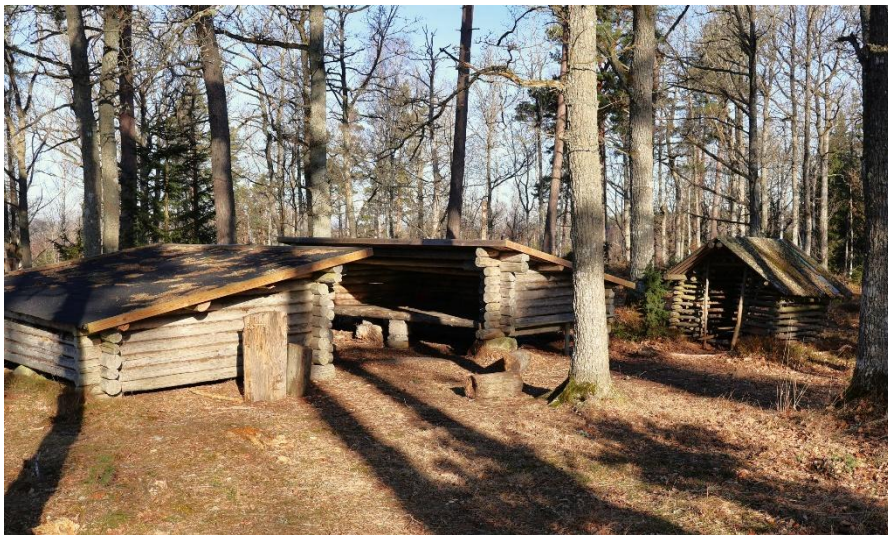
Där på en höjd har Immanuelkyrkan ett fint vindsydd.