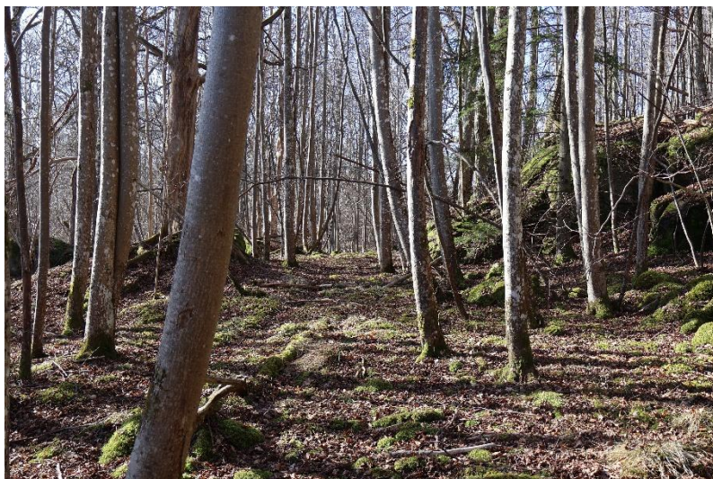
Rågången söder ut, mot Vran. Granbäck mark på östra sidan och Häggeberg på västra