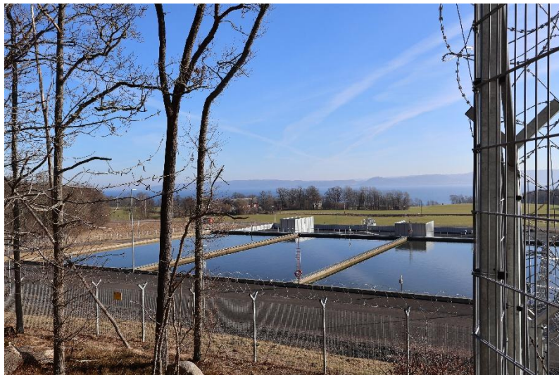
För att sedan pumpas ut till alla i Jönköpings kommun.