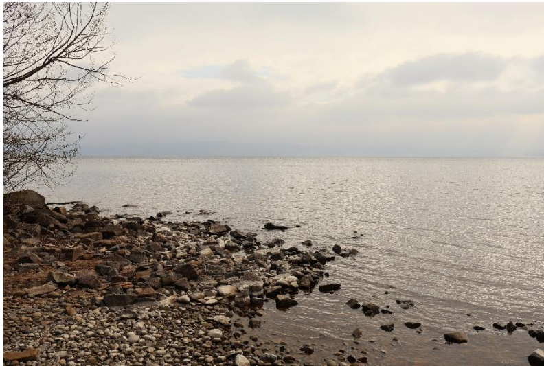
Vättern klarar det bra.