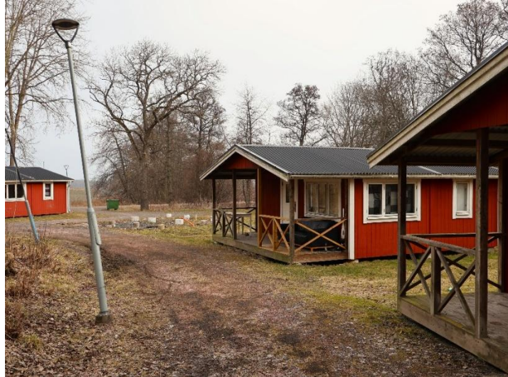
Ett "Kategori-boende" för Jönköpings kommunens missbrukare.