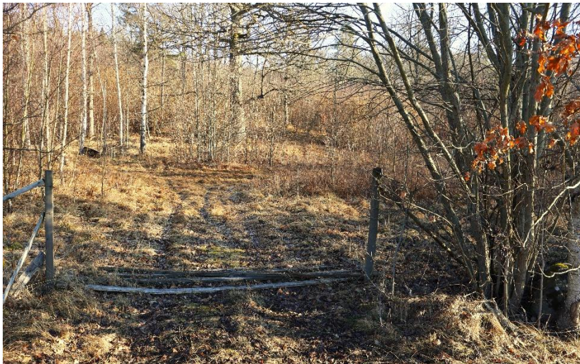
På norra sidan vägen, väster naturreservatet, brant upp genom Flasarp tidigare betesmark