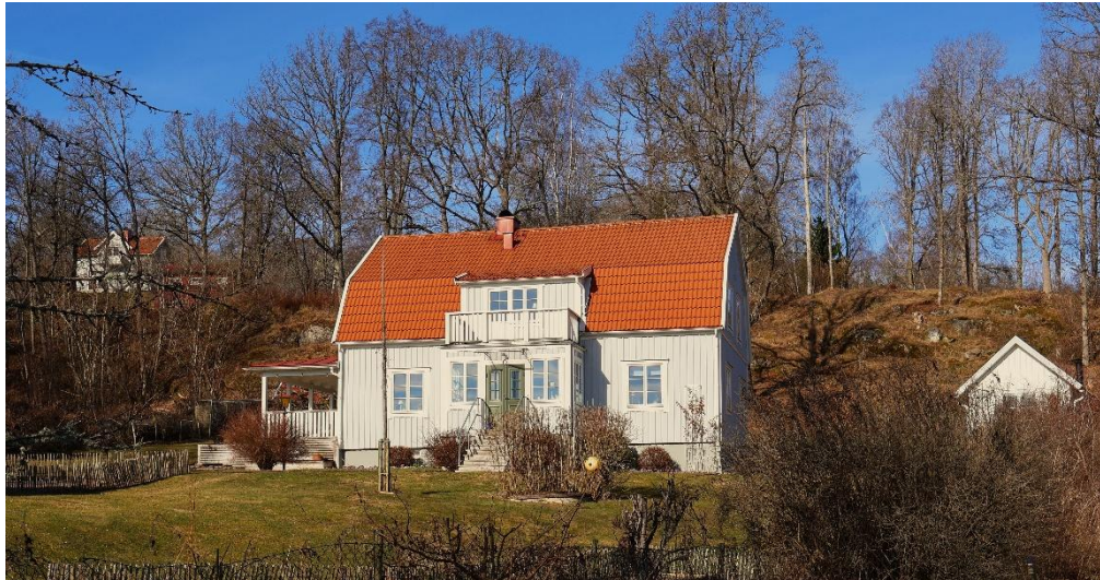
Vråvägen 9. Huset upp till vänster, ligger på Häggebergs mark.