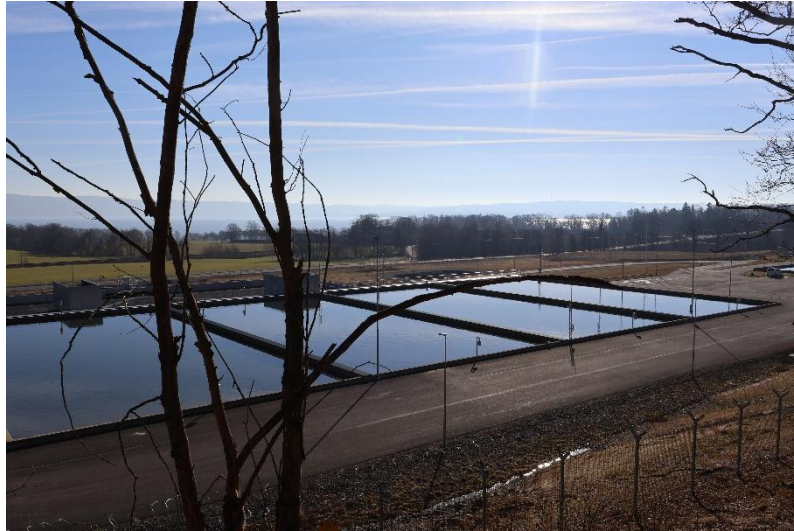
Dricksvatten från Vättern. I bassängerna sjunker vattnet genom finkornigt ”sandfilter”.