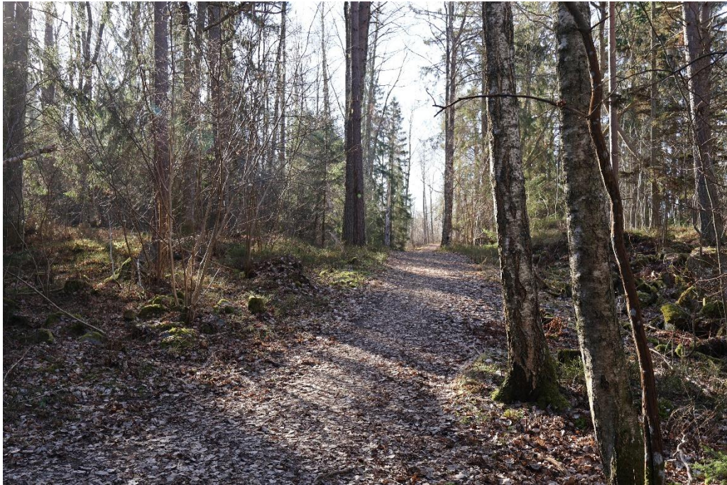
På rågången mot bergbranten