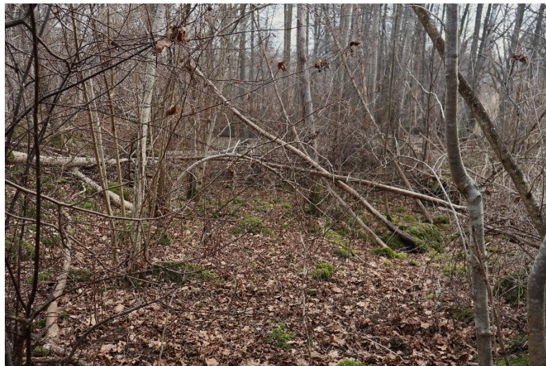
I ett bortglömt Naturskyddsområde.