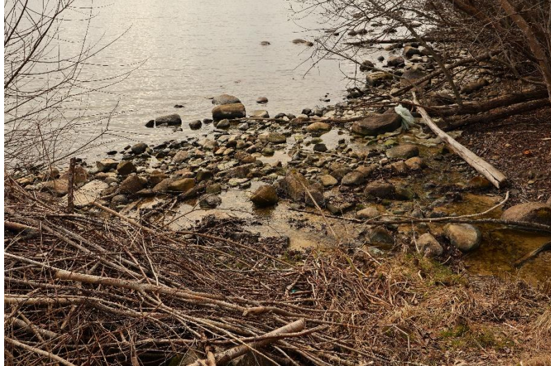
Bäckens os i Vättern är slammigt