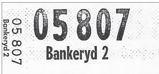
Adressetikett till postpaket.