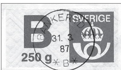
Frankoetikett, stämplad Bankeryd 2.

Den 1 november 1970 namnändrades poststationen till Jönköping 10 och den 1 juli 1973 blev den statushöjd till en sk C-postexpedition. I samband med namnändringen avgick Svenningsson med pension. Efter lång vakans blev Irma Jonsson utnämnd till postmästare i Trånghalla, som i Postens nya organisation fick termen postkontor. Vid en ny omorganisation ändrades dess namn till Bankeryd 2 med 1980 års ingång och från och med november 1983 förändrades dess status till postställe. Detta i sin tur drogs in med mars månads utgång 1987.