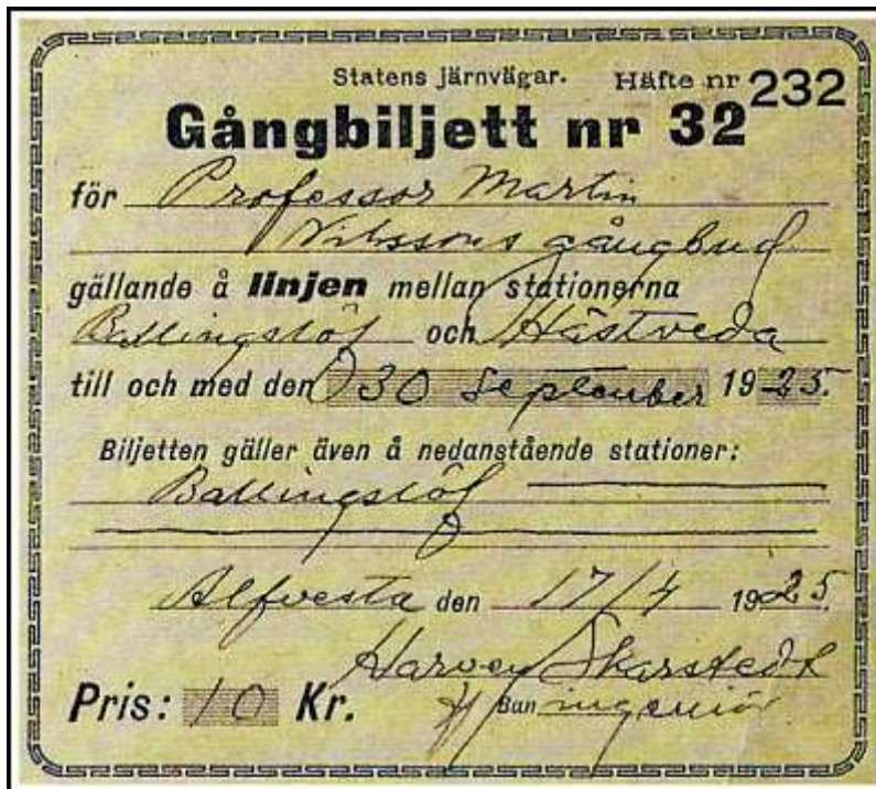
Gångbiljett på Statens Järnvägar utfärdad för Professor Martin Nilssons gångbud