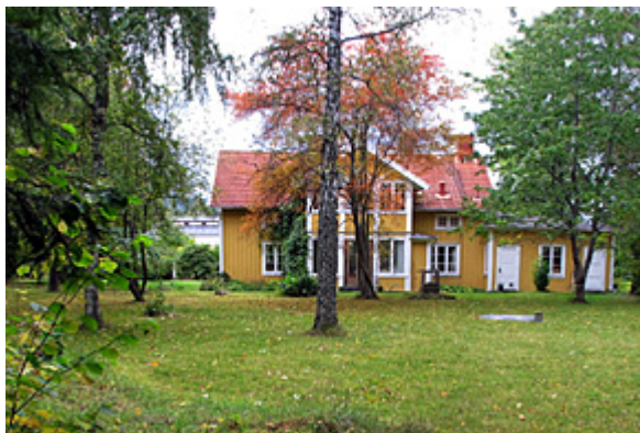
Tomtebo Industrigatan 7, hösten 2016

Efter utbildningen kom hon hem till Bankeryd igen.